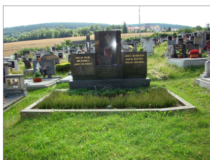
Klenčí - hřbitov