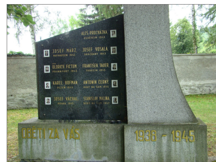
Kout - hřbitov