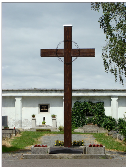
Domažlice - hřbitov