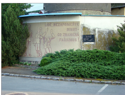
Holýšov - muniční továrna (dnes SVA)